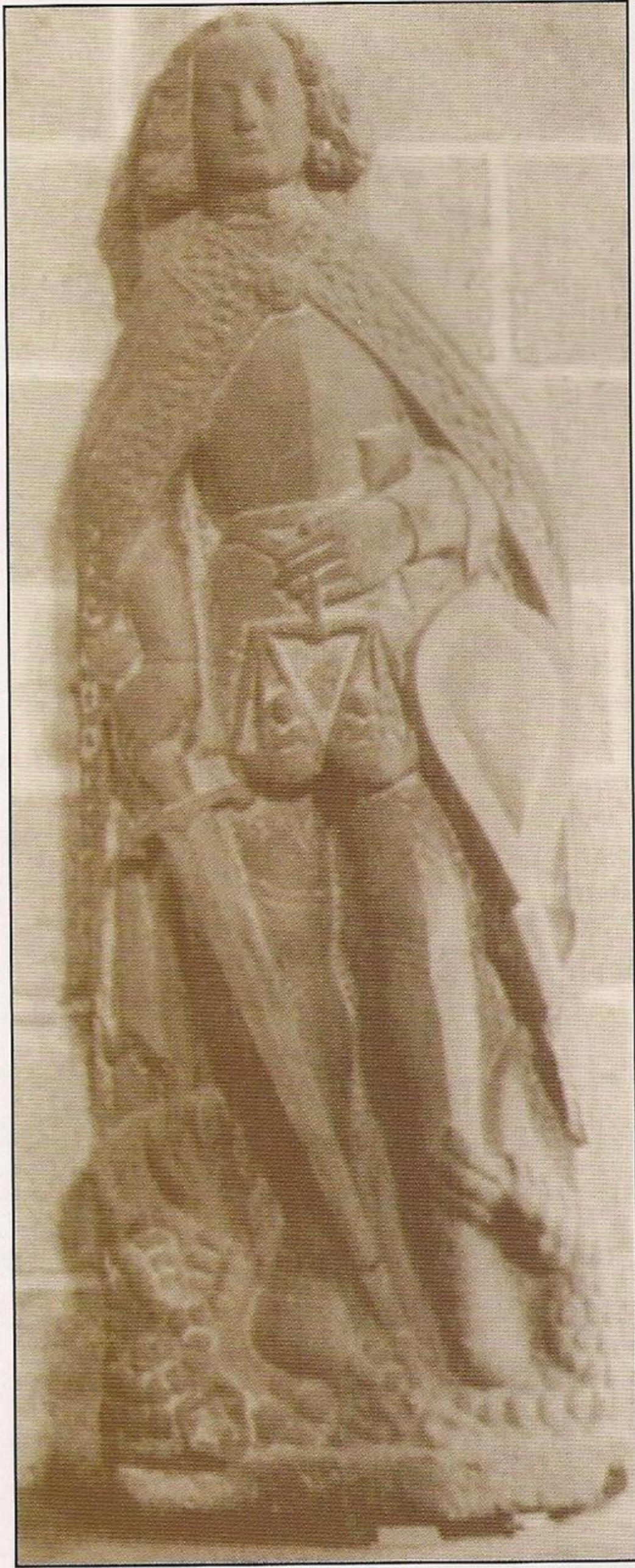
Estatua de san Miguel, con la típica armadura francesa de mediados del siglo XV, en una iglesia en Locronan, Bretaña.

cieran con todo el país. Así pues, cuando Juana de Arco irrumpió en escena en 1420, se encontró con unos soldados y un rey dispuestos a dejarse inspirar por su particular visión de la liberación.