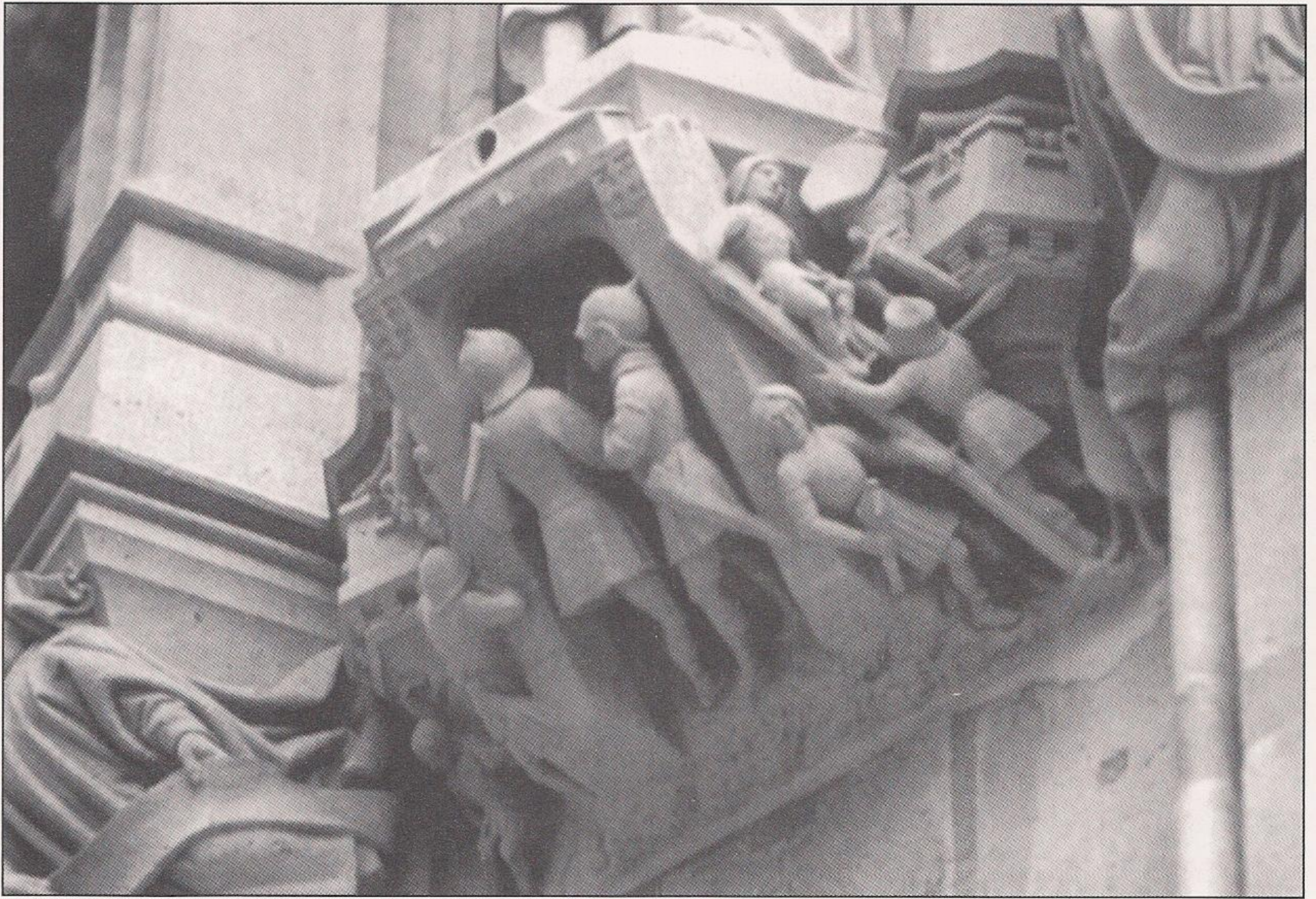
Escultura del Hotel de Ville, en Lovaina, que representa, extrañamente, un asedio: los hombres de armas intentan forzar la puerta mientras los soldados sitúan escalerillas para subir la muralla. ( In situ, Hotel de Ville, Lovaina,).

piègne sana y salva el 23 de mayo de 1430. Al día siguiente encabezó una incursión por el río contra el campamento burgundio. Entre sus hombres, más interesados en el botín, cundió la disciplina y se vieron obligados a retroceder a la ciudad. El puente levadizo fue izado para mantener a los perseguidores fuera, pero Juana aún no había entrado y fue capturada, junto a dos de sus hermanos y un paje que había estado a su lado desde que vistió la armadura por primera vez. Como prisionera de Juan de Luxemburgo, fue confinada en el castillo de Beaurevoire. Desesperada por regresar a Compiègne y alentada por sus voces, intentó escapar saltando desde una torre, y resultó herida, aunque no de gravedad.