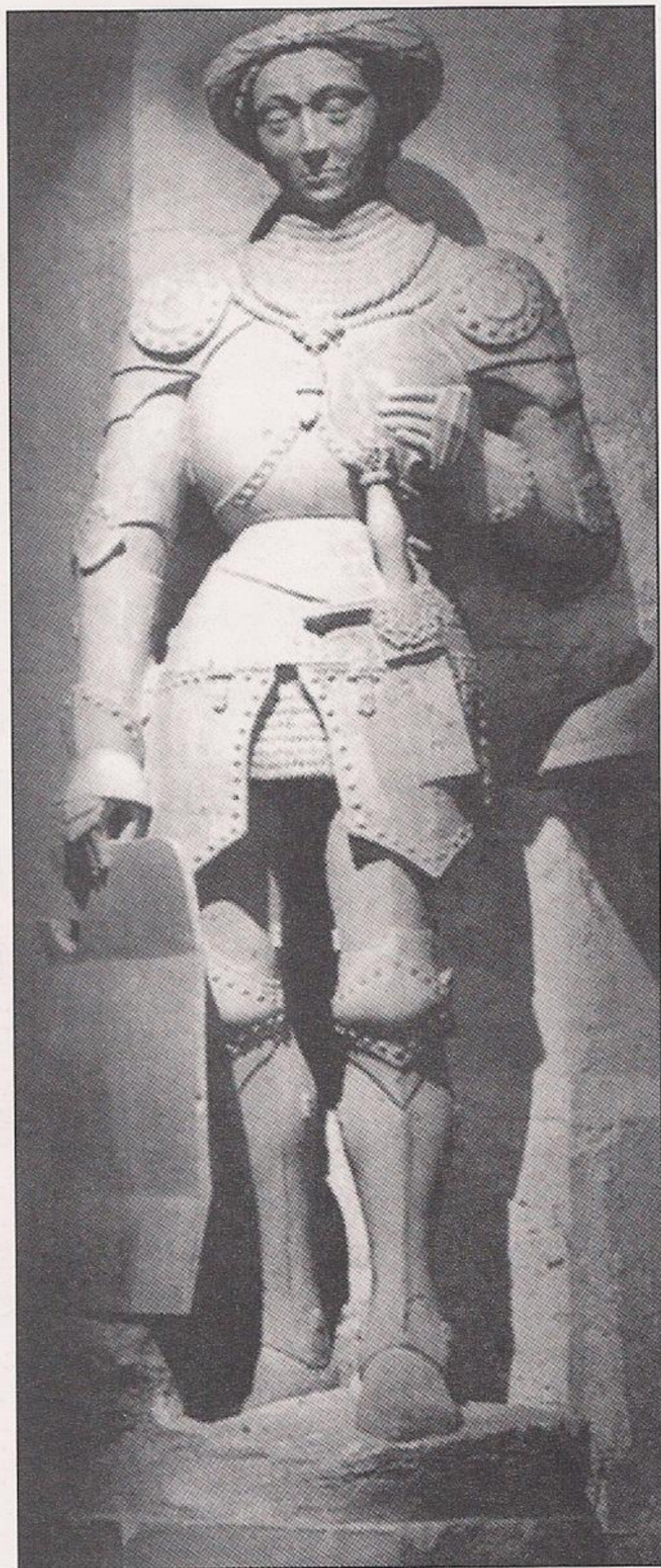
Una hermosa y realista estatua de Dunois, el "bastardo de Orleans", con armadura francesa del siglo XV, y una corona de laurel. (In situ, Sainte-Chapelle, Château de Châteaudun).

Dunois regresó el 4 de mayo con más tropas. Los franceses atacaron el bulevar Saint-Loup, las fortificaciones de asedio de los ingleses al este de la ciudad, quizá como una maniobra diversiva para dejar el paso libre al convoy de Dunois. Juana, seguida por una numerosa banda de voluntarios, salió para unírseles, y lo que había sido una simple incursión se acabó convirtiendo en un ataque en toda regla de unos 1.500 hombres. Cuando el comandante inglés, lord Talbot, fue informado preparó un ataque diversivo, pero cuando el humo procedente del este confirmó que Saint-Loup había caído, abortó su propio ataque. Según el cronista Enguerand de Monstrelet, los 300 o 400 ingleses de Saint-Loup cayeron muertos, heridos o capturados. "Luego, la Doncella regresó a Orleans con todos sus caballeros y hombres, y allí se celebró una fiesta en su honor y fue aclamada con regocijo por los hombres de todos los rangos."