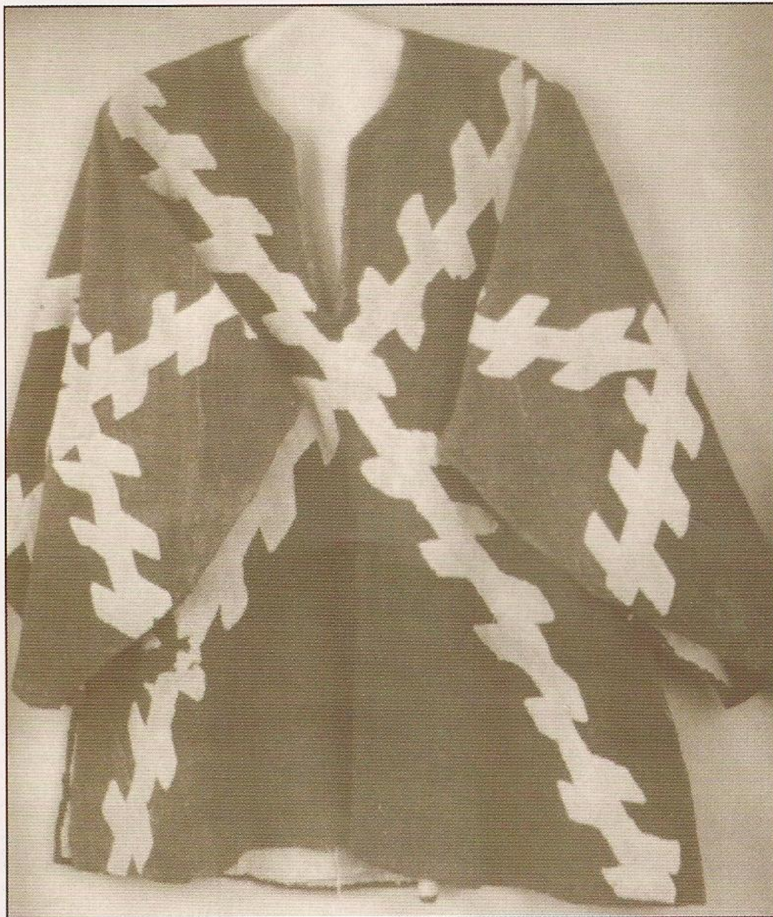
Heraldo francés con un tabardo, uno de los raros ejemplos que nos han llegado de la vestimenta militar del siglo XV. (Museo del Hermitage, San Petersburgo,).

El mismo día, un ejército inglés de refuerzo formado por 4.000 hombres, partió de París encabezado por el vencedor de la batalla de Herrings, sir John Fastolf, y acampó cerca de Janville en Les Plaines de la Beauce, a unos 35 kilómetros justo al norte de Orleáns. Su presencia no disuadió a Juana de atacar los puestos ingleses de Meung y Beaugency, y Fastolf se unió a Talbot para ayudarles. Pero cuando supieron que la guarnición de Beaugency se había rendido, decidieron retirarse a Janville.