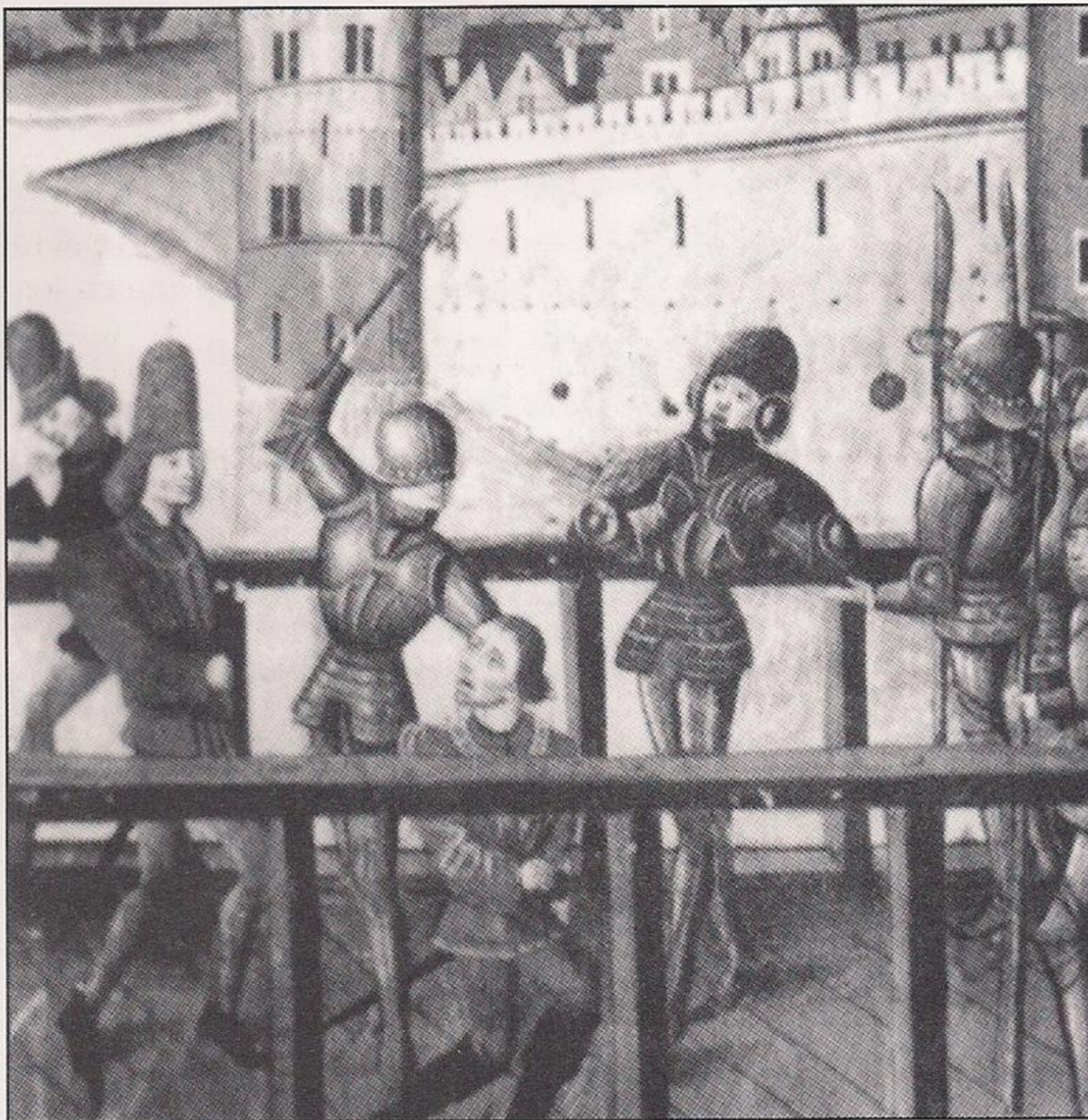
El asesinato del duque de Burgundia por los partidarios de los Valois puso a los burgundios del lado de los ingleses. ( Chronicle of Enguerrand de Monstrelet , Bib. Arsenal, París).

Los días siguientes fueron de cierta tranquilidad. Dunois regresó a Blois a por más hombres, y Juana y sus compañeros patrullaban las calles animando a sus habitantes y levantando su ánimo. Se aventuraron fuera de las murallas de la ciudad para vigilar al enemigo. Juana informó de que eran más débiles de lo que había pensado.